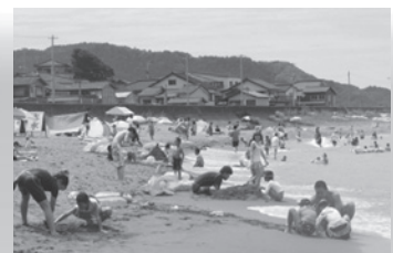
▲藤崎海水浴場 能生商工会HP http://www.noumachi-syoukoukai.or.jp/