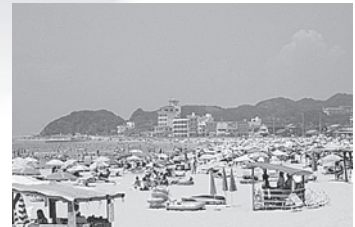
▲南知多町海水浴場